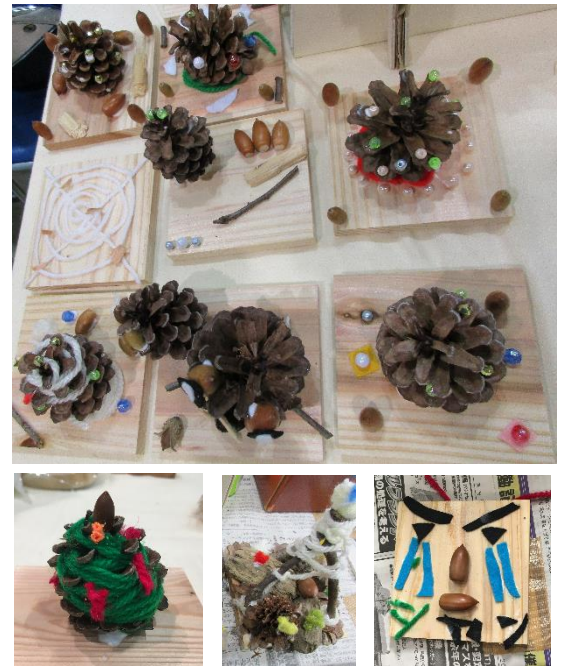
工作ワークショップ