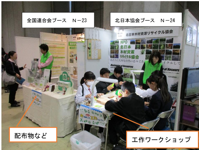
全国連合会ブース N-23