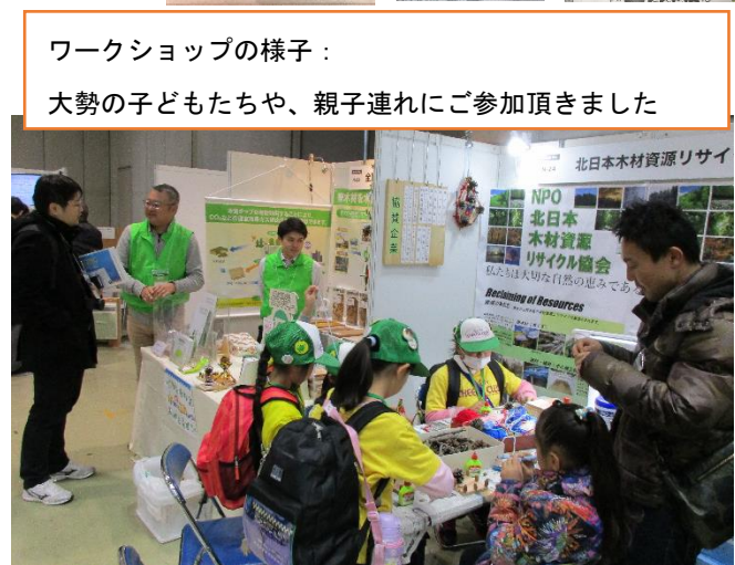
ワークショップの様子： 大勢の子どもたちや、親子連れにご参加頂きました